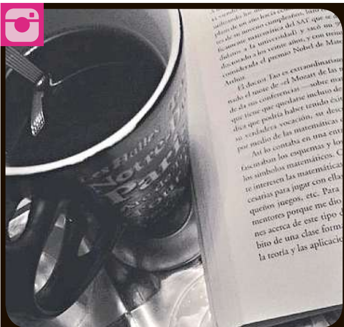
Sadamuz Pequeños grandes placeres! # leer #tfrutosrojos