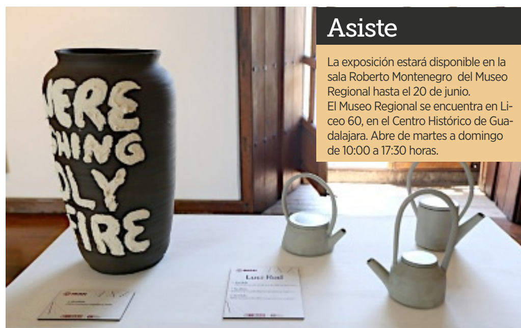
■ Obras de Luci Rod que son parte de la muestra "Dentro de la carne hay una forma espaciosa".

emergentes u otras ya no tanto, que merecen mostrar su trabajo porque han reflexionado sobre temas muy importantes. Aquí la mayoría de las artistas son muy jóvenes con un potencial que estamos tratando de alentar. En ese sentido trabajamos el discurso con algunas de ellas para adaptarlo a esta sala del museo", explica Rubén Méndez.