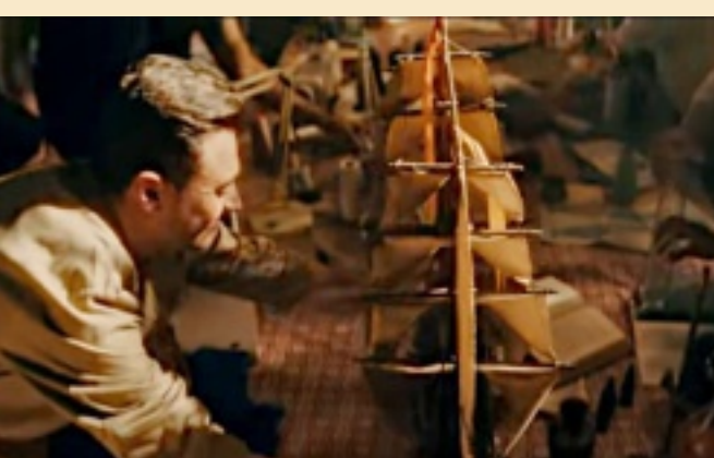
■ Los Buendía saltarán a la pantalla en una serie con un presupuesto de más de 80 millones de dólares, según Jaime Abello.

Lo importante, enfatizó, es que se respete la poética de la narración de la gran obra del Nobel colombiano.