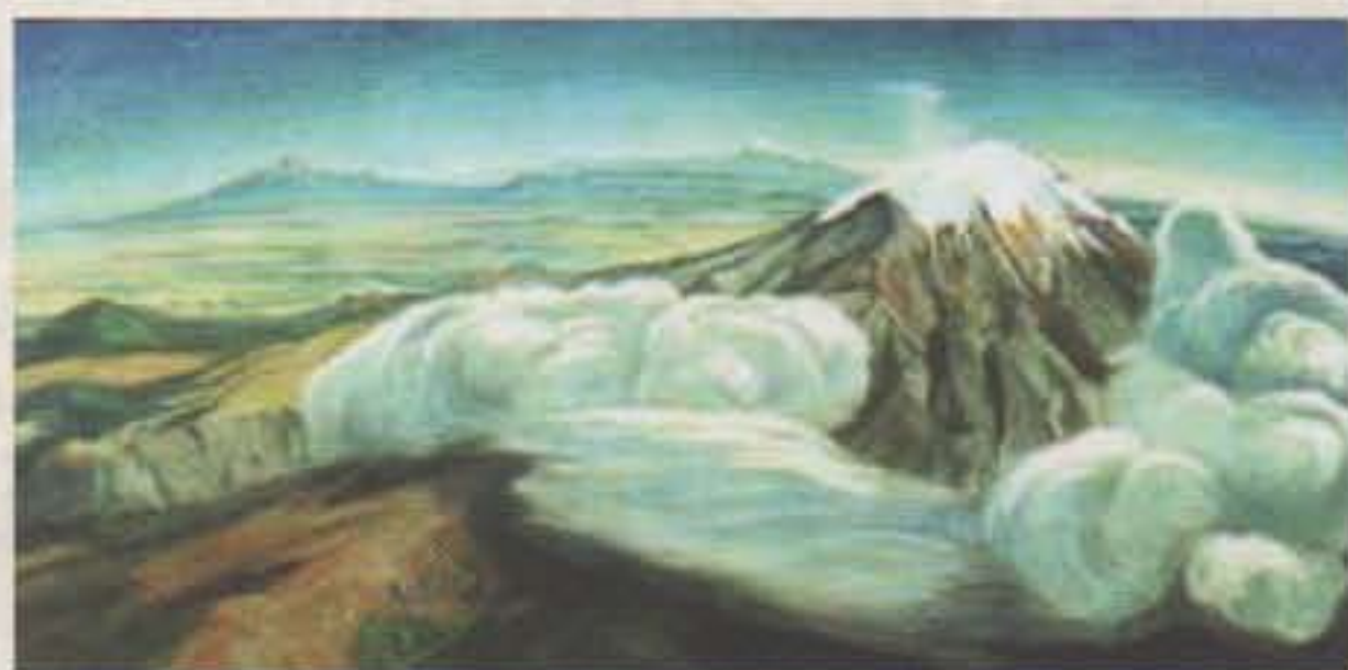
Gerardo Murillo "Doctor Atl" Volcanes, 1950 Atl color sobre fibracel