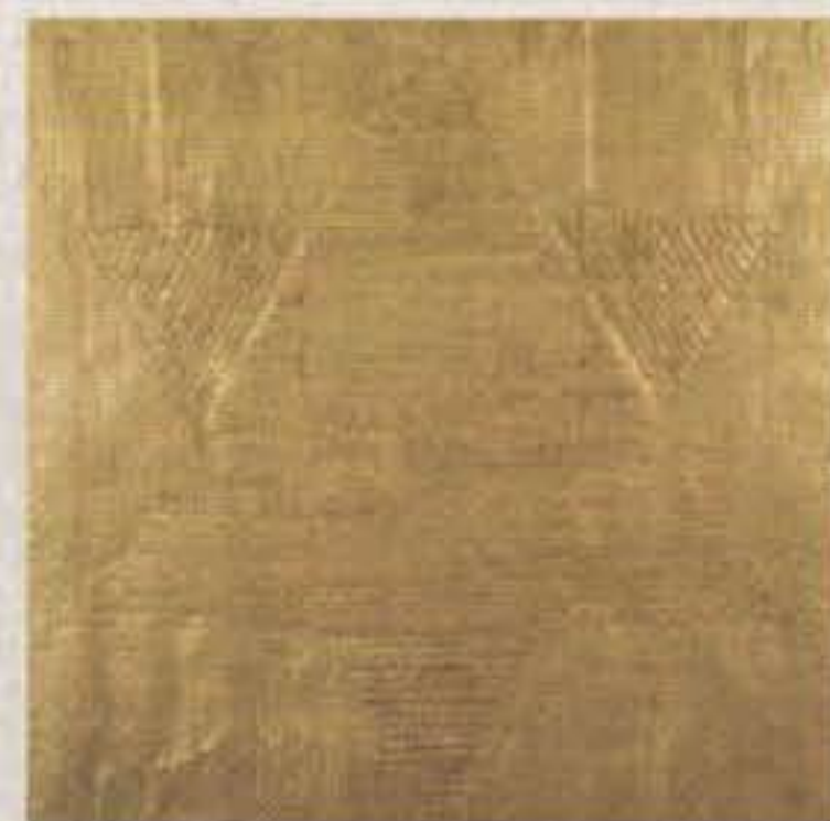
Mensaje, s/f Lámina de metal dorada y perforada sobre madera