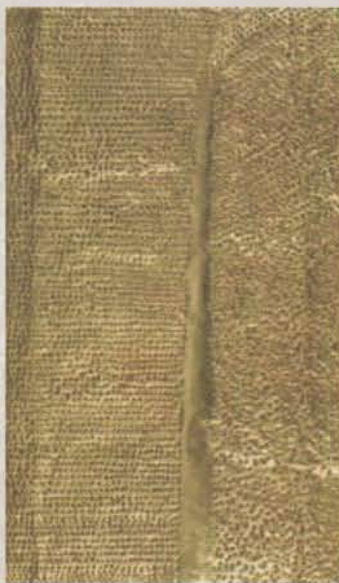
Mensaje, 1978 Lámina sobre madera

La colección Mathias Goeritz (donada a esta institución en 1994 por Ana Cecilia Treviño gracias a las gestiones del arquitecto Julio de la Peña) está conformada por obras que abarcan prácticamente toda su producción artística: obra en papel producida en los años 40s, esculturas en bronce, metal y madera, series de bules, la vía láctea, su archivo documental que incluye fotografías y una extensa correspondencia que recibió Goeritz de amigos y artistas durante su larga estancia en nuestro país; parte de su biblioteca y un extraordinario conjunto de mensajes en diferentes formatos que hacen de ésta una gran colección.