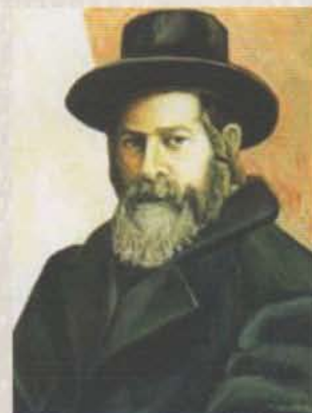
Ignacio Aguirre El Rabino, 1959 Óleo sobre tela