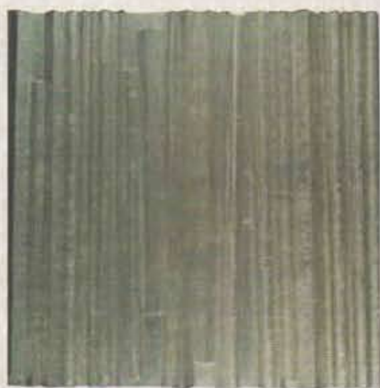
Mensaje, ca. 1986 Aluminio y latón sobre madera

La obra de Goeritz está atravesada por un profundo sentido espiritual, marcada por una constante duda entre el bien y el mal, lo bello y lo feo, la verdad y la mentira, la pureza y la corrupción. Su concepción del arte se desborda a tal grado que renuncia a la idea del artista como creador único y lleva su hacer al terreno de la producción en equipo, recordándonos con ello la forma de trabajo del taller medieval en el que lo importante de la producción es el objeto artístico y no la firma de quien lo patenta. En el caso de Mathias importaba más la obra que la propia realización.