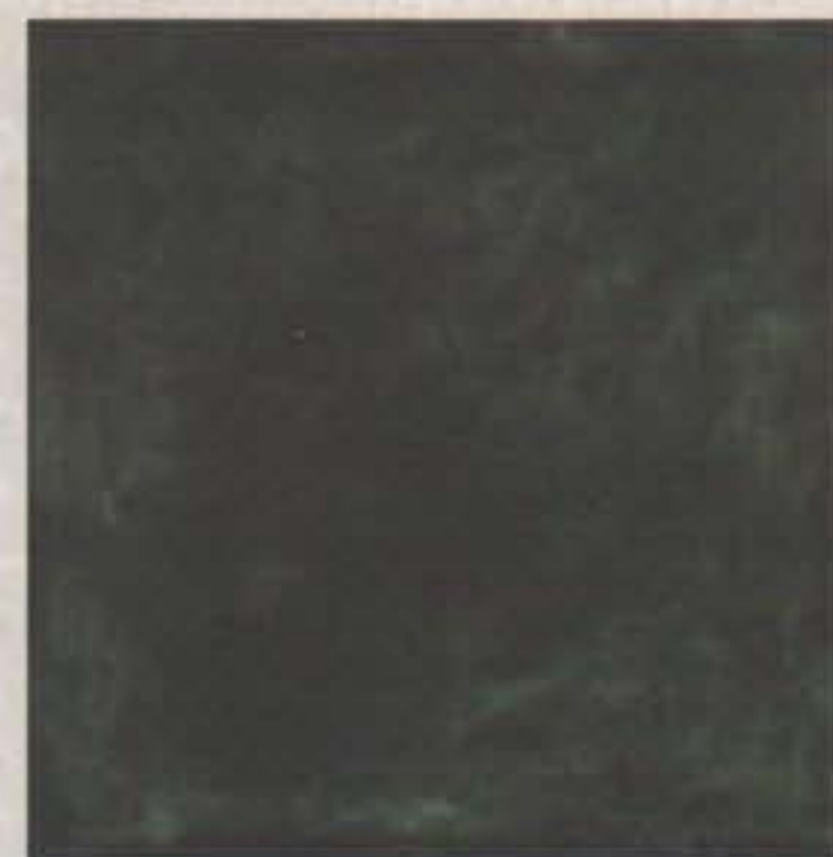
Mensaje, s/f Bronce sobre pátina verde