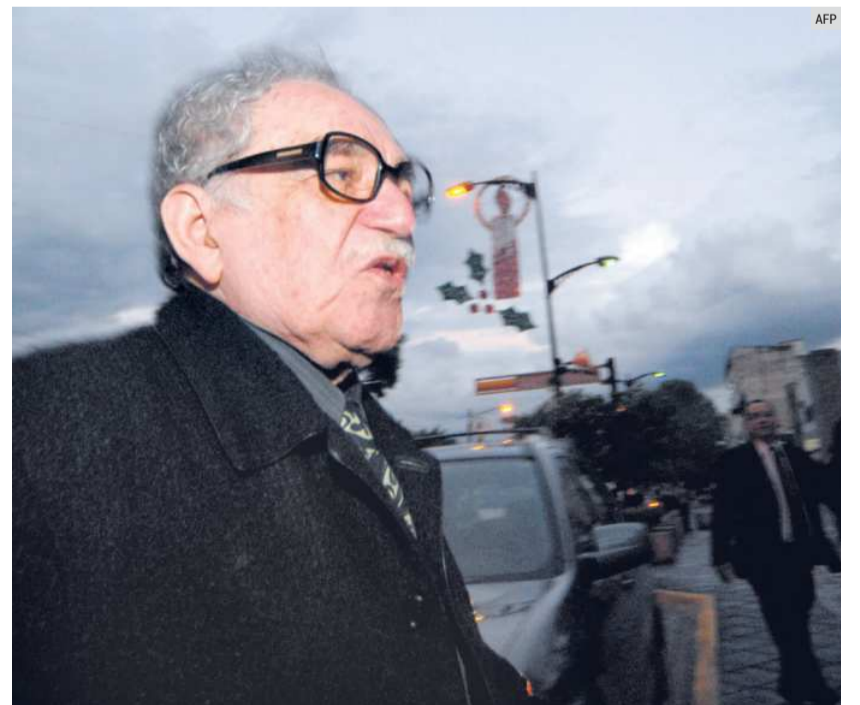
GABRIEL GARCÍA MÁRQUEZ. El premio Nobel de Literatura colombiano, a su llegada a la cátedra Julio Cortázar, en la Universidad de Guadalajara.