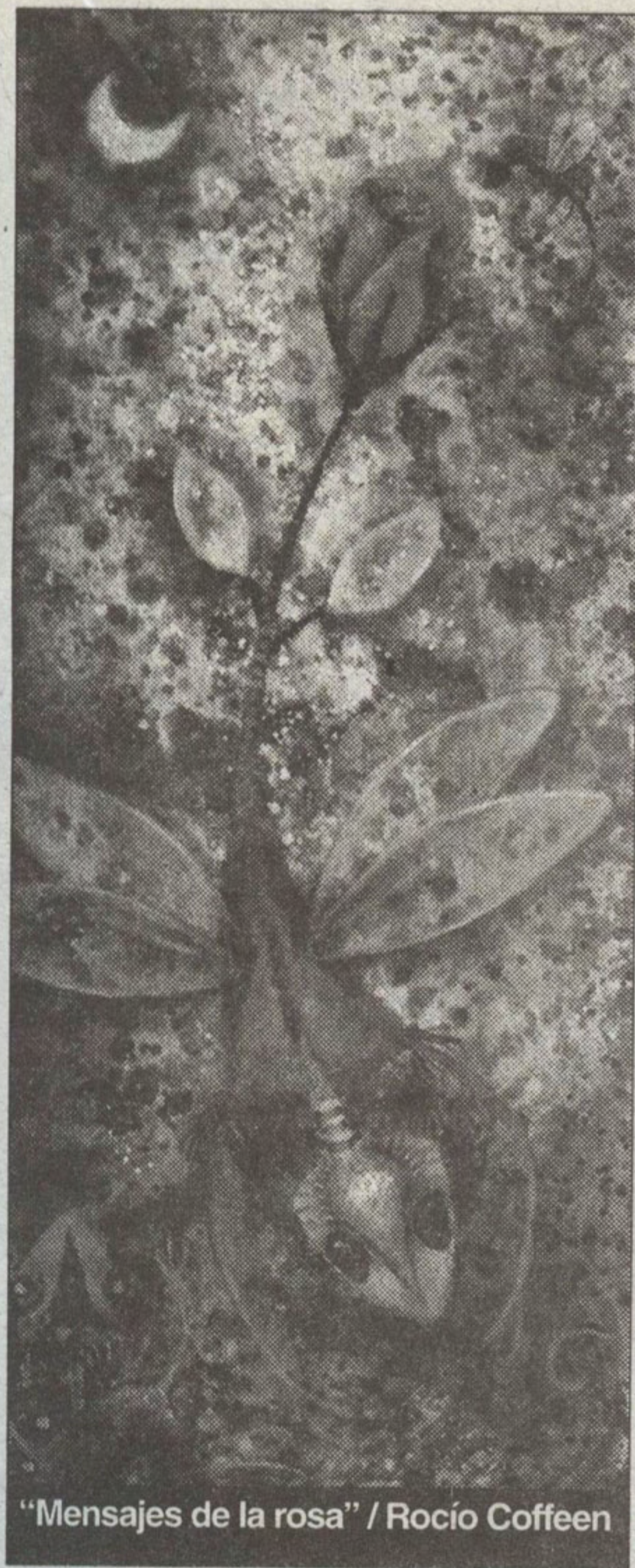
"Mensajes de la rosa" / Rocío Coffeen