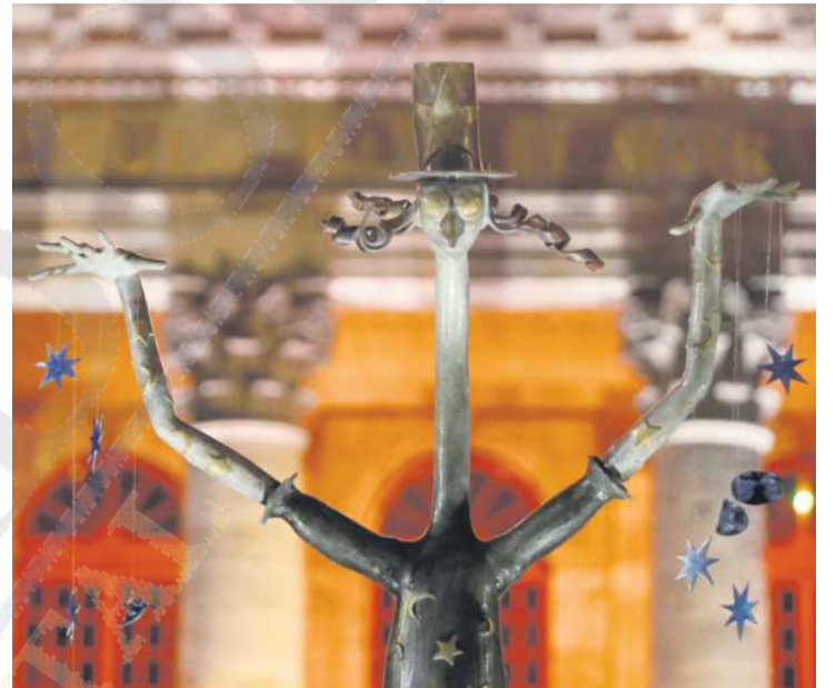
"MAGO PULPO TEATRAL". La escultura se encuentra ubicada en la explanada del Teatro Degollado.