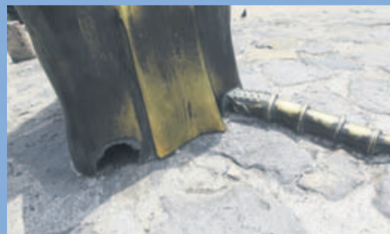
DAÑOS. La escultura presenta piezas carcomidas.

"Muchas de estas piezas son realizadas a la cera pérdida o moldes en arena, son piezas que se realizaron una sola vez, nunca se hicieron moldes. Contamos con el autor y él nos planteará la mejor manera de resolver y modelarlas nuevamente a partir del archivo fotográfico que hay".