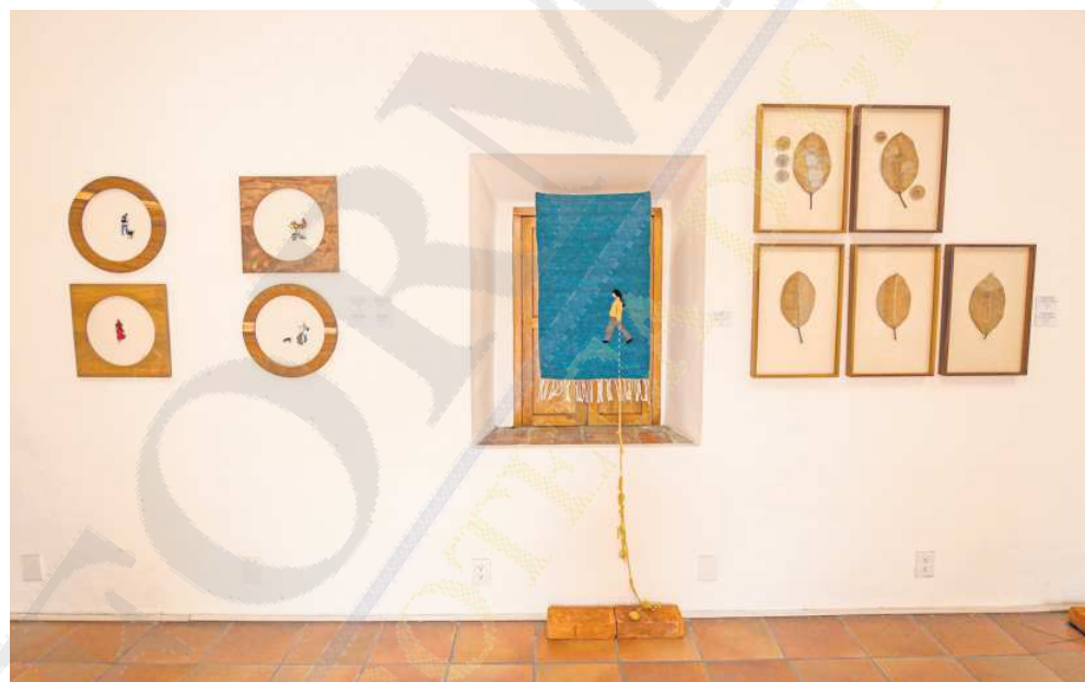
OBRA. Los materiales con los que Arcelia trabaja son de fibras naturales.

las hojas las recolecto en mis caminatas, suelo caminar todos los días y desde ahí es el punto de partida de mi proceso creativo, vivo en una zona céntrica que me permite acercarme a cualquier sitio de manera muy fácil y esto me da el espacio para detenerme a observar y recolectar muchas cosas, como las hojas, a las que les doy un tratamiento especial para po-