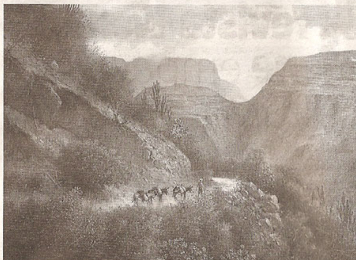
Los paisajes de Alfredo Gómez destacan por su técnica depurada