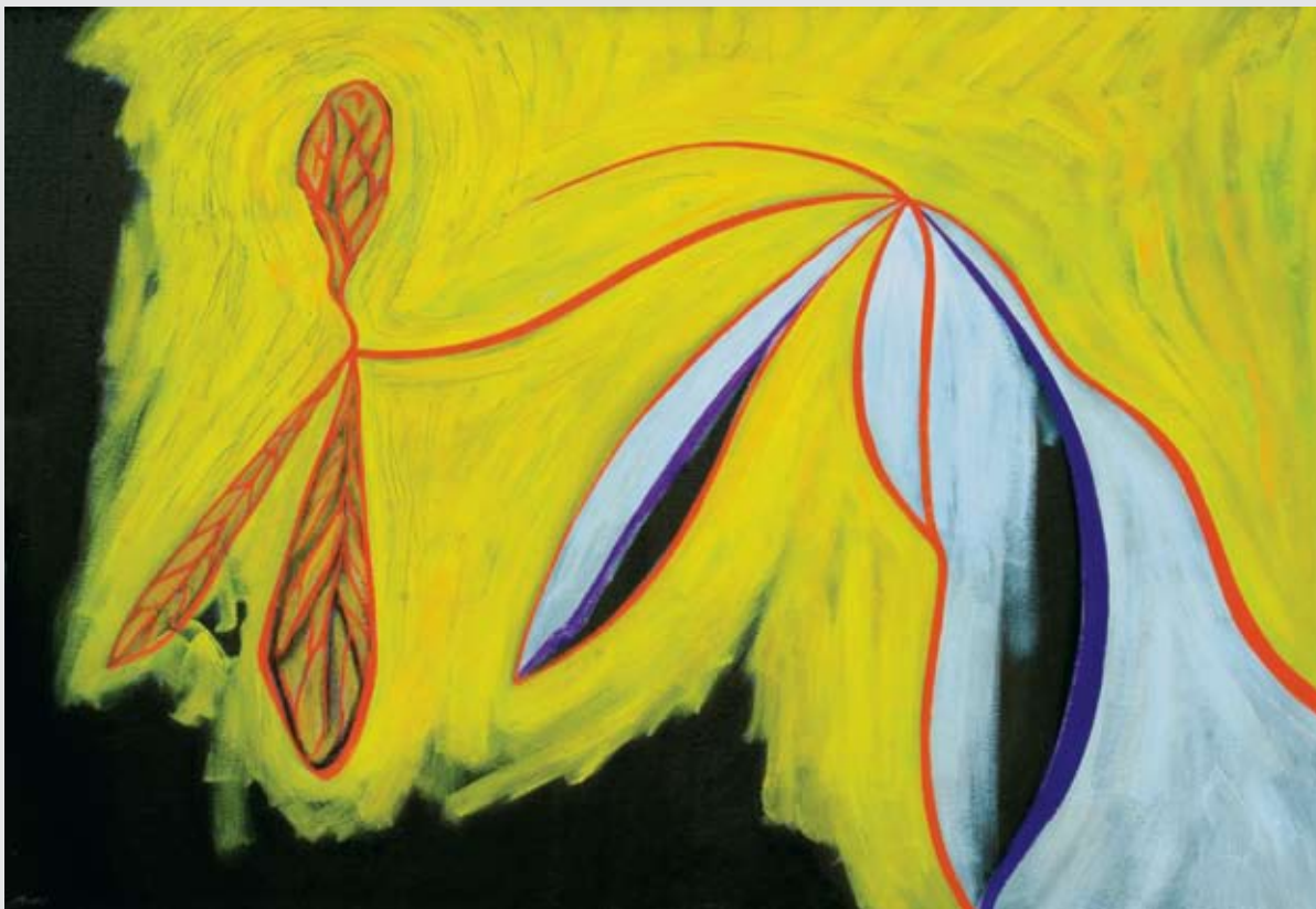
Vaina, nido, capullo y alas 2010