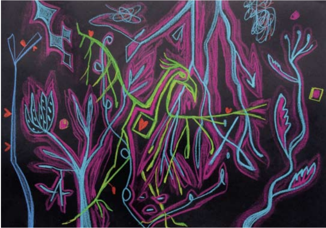
El paseo del Sr. Águila 2010