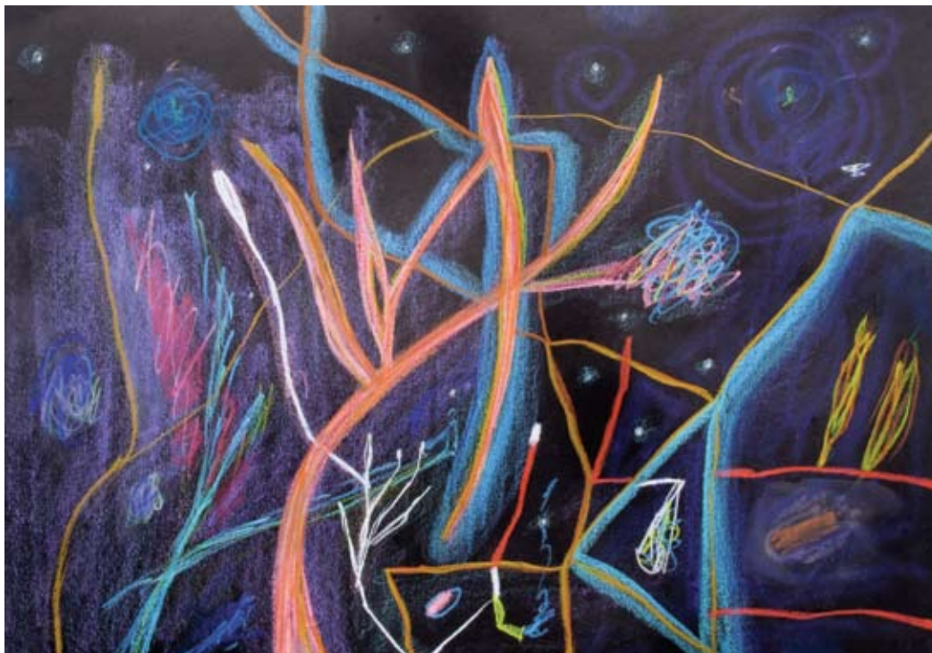
Ave del paraíso 2010