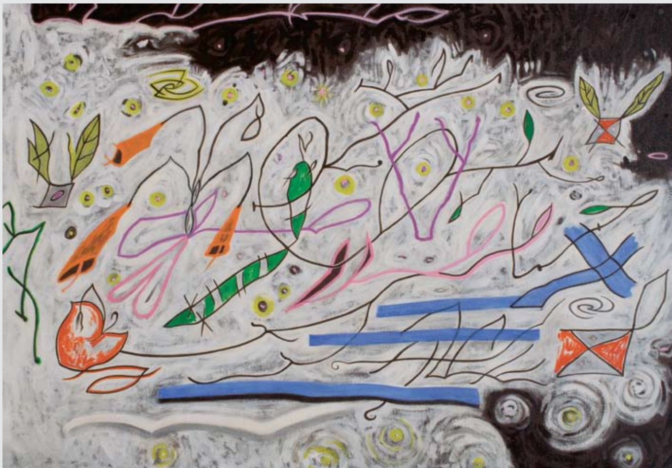
El Río el primer río 2009