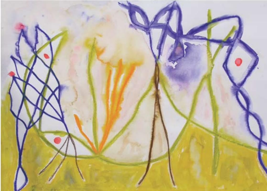
Señor venado que siembra 2010