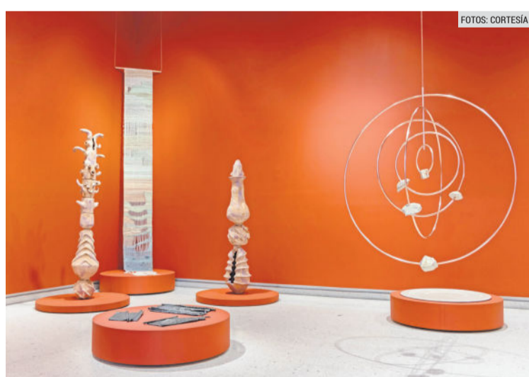
ARTE. Las piezas invitan a la reflexión a través de sus líneas abstractas.