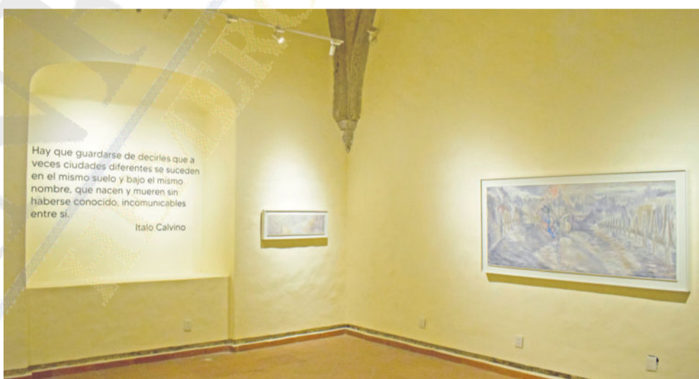
ARTE. La exhibición narra una historia a través de pinturas ejecutadas con una paleta casi monocromática.

Ha participado en muestras colectivas en los principales museos de México y en países como: España, Rumania, Estados Unidos, Francia, Austria, Eslovenia, Checoslovaquia y Suiza. Su obra forma parte de las colecciones permanentes del Museo de las Artes de Guadalajara, el Museo de Arte Contemporáneo de Monterrey y el Museo de Arte Contemporáneo de Aguascalientes.