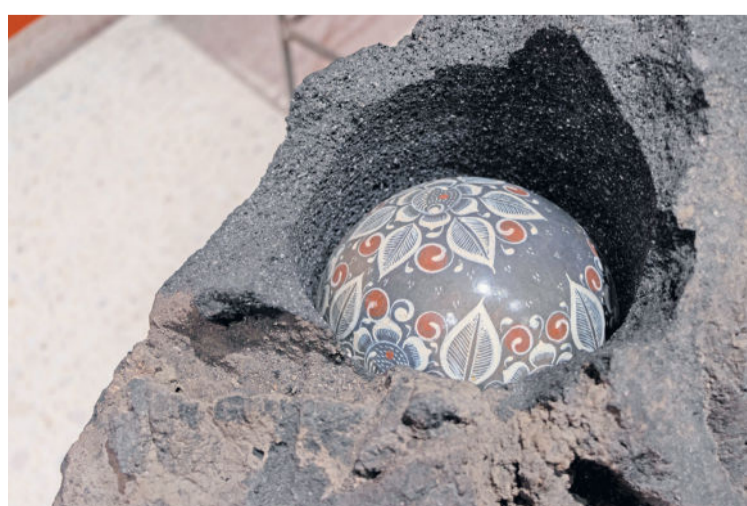
SENSIBILIDAD. Cada obra sostiene un diálogo entre los diversos materiales que conforman las piezas.