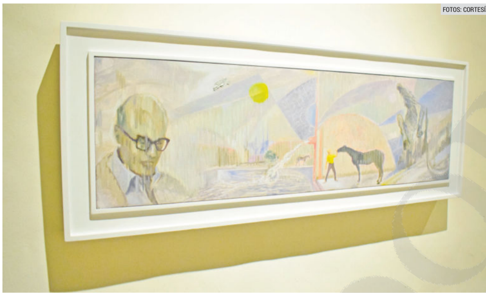
“EPISODIOS TAPATÍOS”. La muestra es una selección de 14 piezas al óleo sobre tela del pintor tapatío, realizada bajo la curaduría de Laura Ayala.

Además, entre los próximos planes que tiene el artista, refiere que está trabajando de