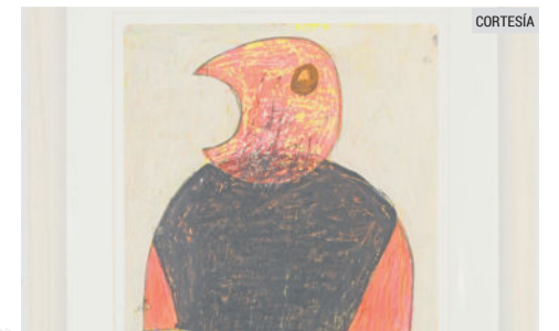
ARTE. La exposición es una oportunidad para explorar el mundo visual de uno de los artistas más destacados de México.

Hoy llega a la Cámara de Comercio de Guadalajara la exposición “Boomerang” del reconocido pintor mexicano Miguel Castro Leñero, uno de los principales exponentes del arte contemporáneo mexicano en el mundo.