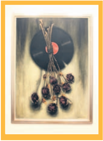
RECUERDOS MUERTOS. Acrílico sobre tela de la artista Carmen Borde.