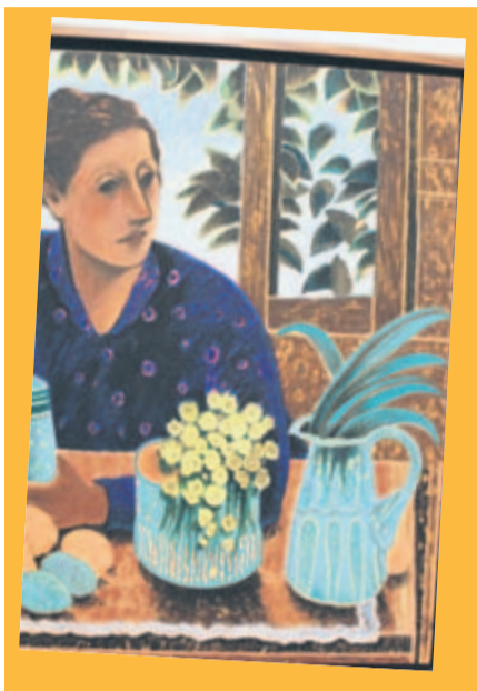
RECUERDOS MUERTOS. Acrílico sobre tela de la artista Carmen Borde.