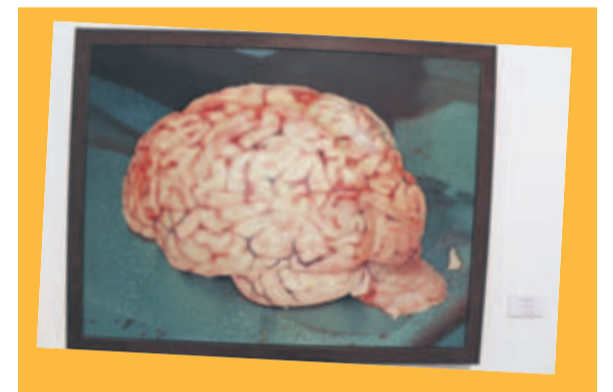
SIN TÍTULO. de Martha Pacheco, creado en 2010.

Al margen del montaje artístico, el Cabañas dio a conocer que habrá otras actividades paralelas para complementar la muestra, como charlas y conferencias. La intención, agregan, es enriquecer la experiencia de los visitantes.