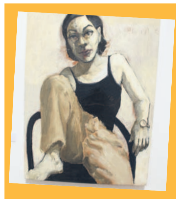
ELENA IV. Pieza de Juan Carlos Macías.