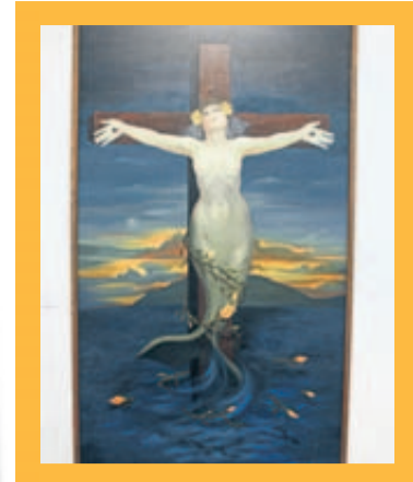
LA CRUZ DEL MAR. Original de Lucía Maya.