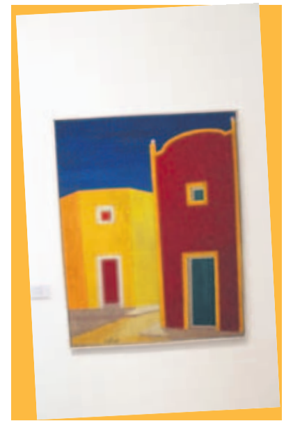
CASA DE TLAQUEPAQUE. Óleo sobre tela creado por Tomás Coffen.