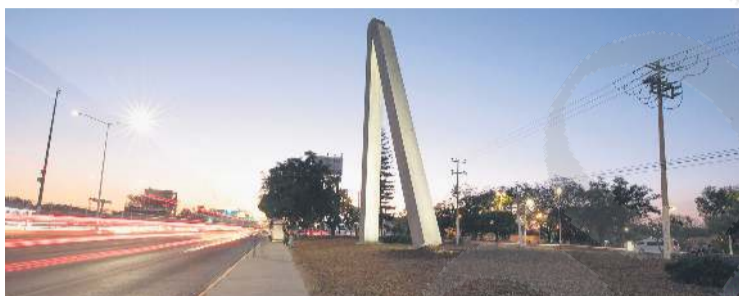
"DOS MONOLITOS DE CONCRETO"