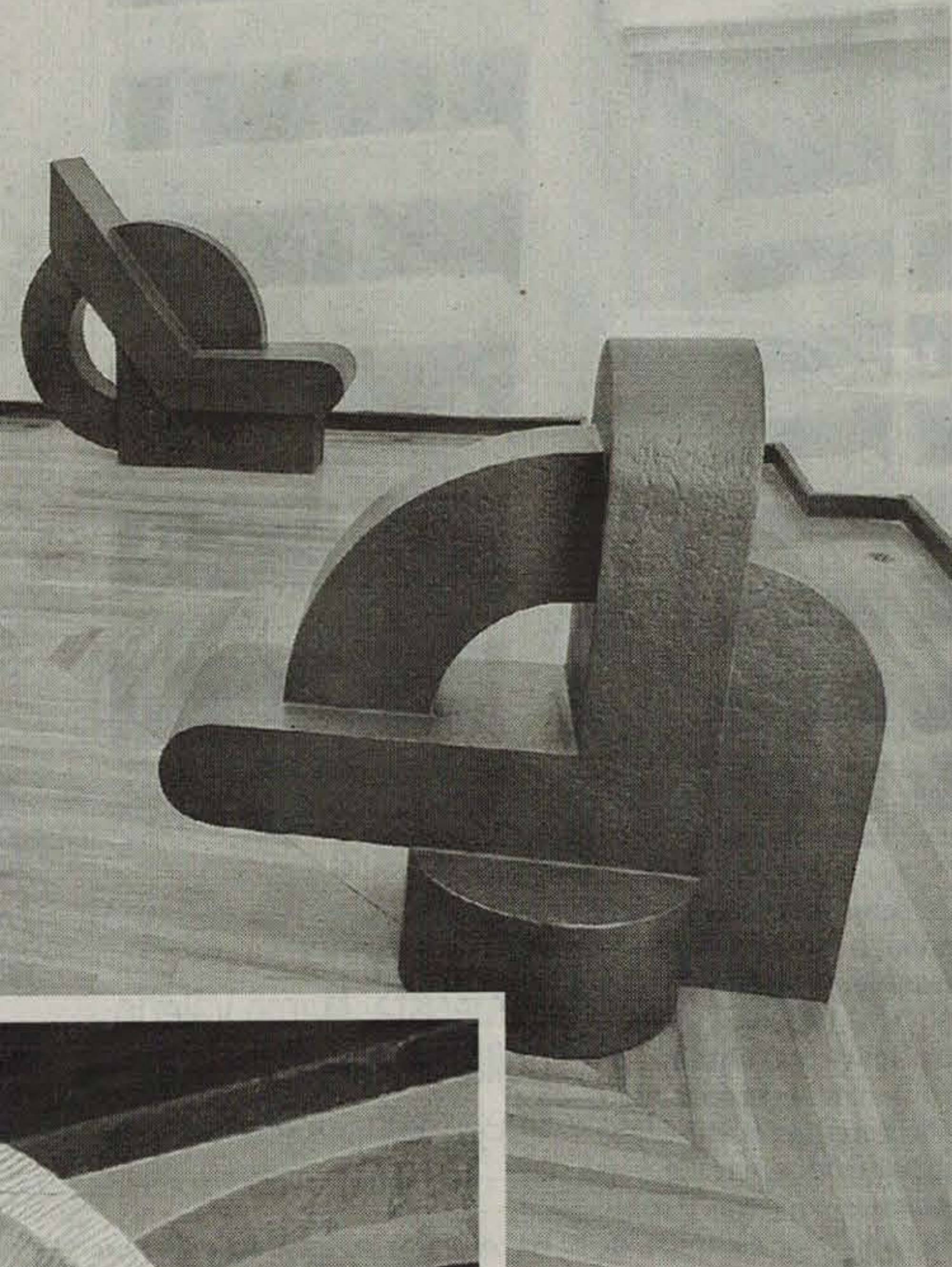
Esculturas de Casa de Letras creadas por Vicente Rojo y que se exhiben en el ICC