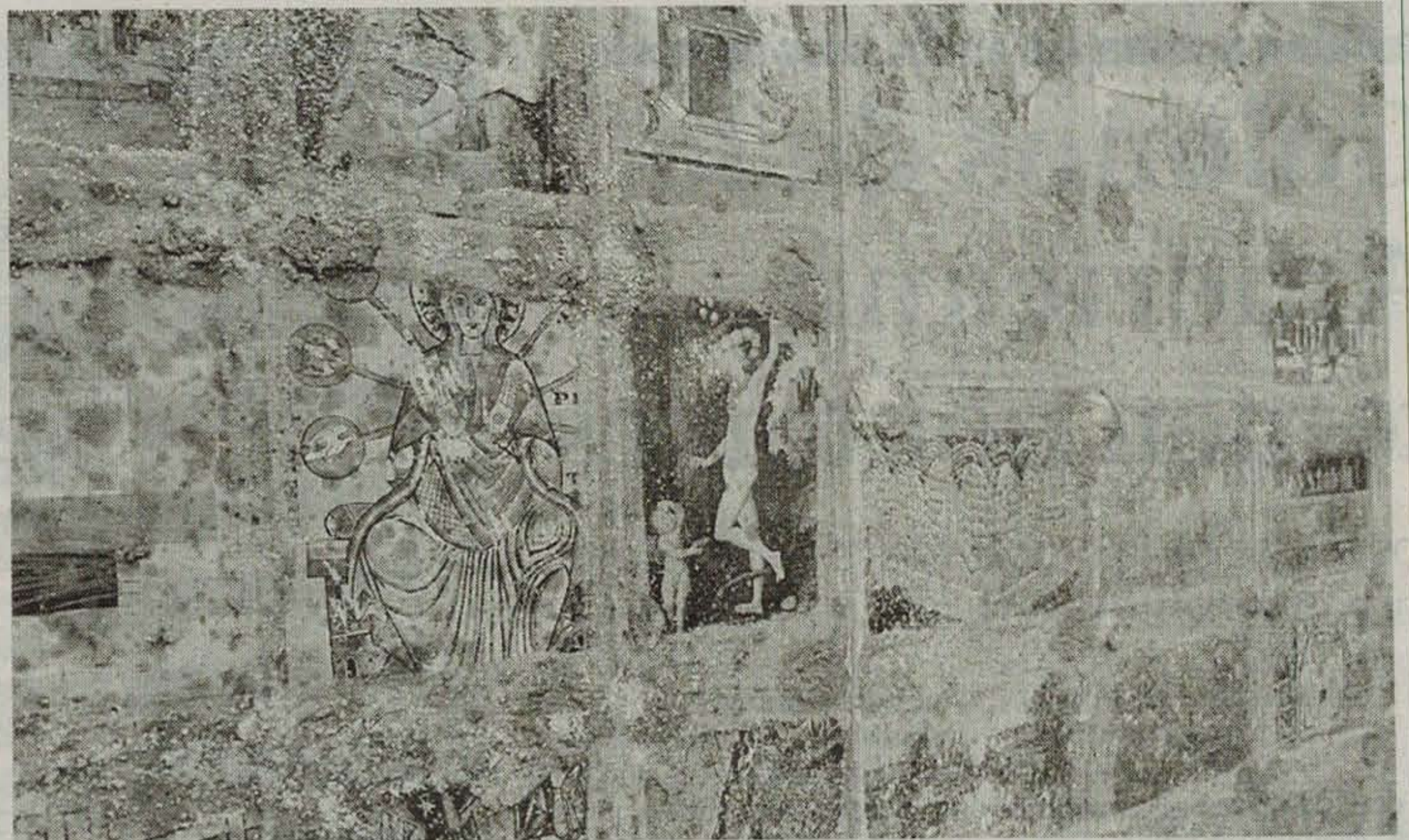
Obra del artista Vicente Rojo de la exposición Escrito Pintado