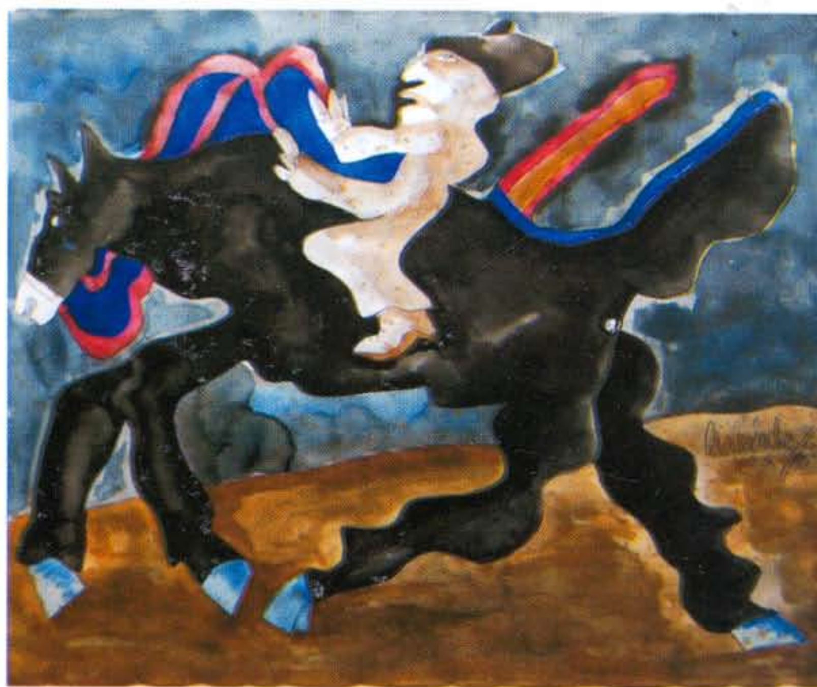
“Jinete II”. Gouache/Papel, 35x42 cms. 1982.

JUEVES 22 DE ABRIL DE 2010 A LAS 20:30 HRS.