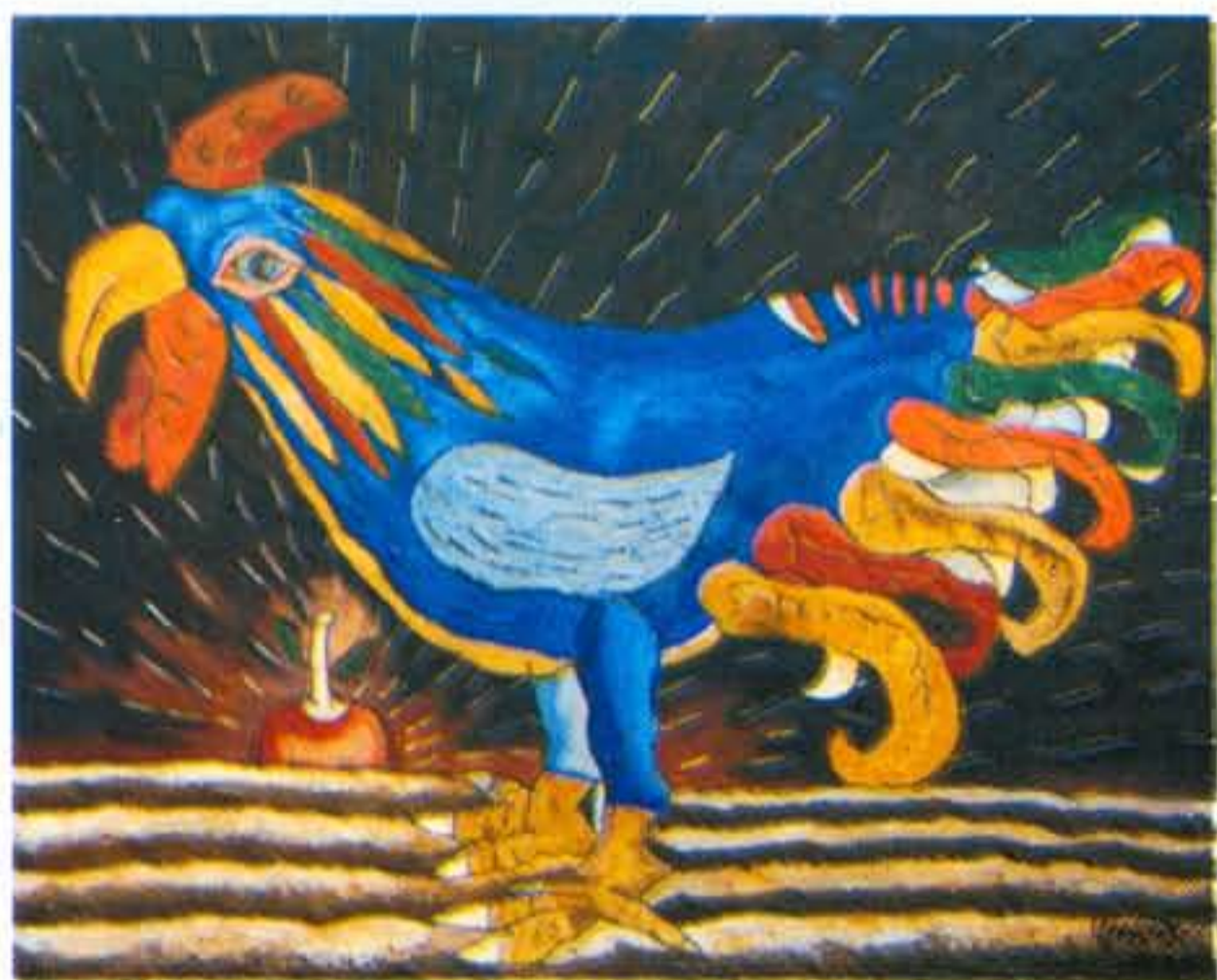
"Este es mi gallo". Mixta/Tela, 1998.

Entre las numerosas exposiciones en que ha participado deben destacarse: