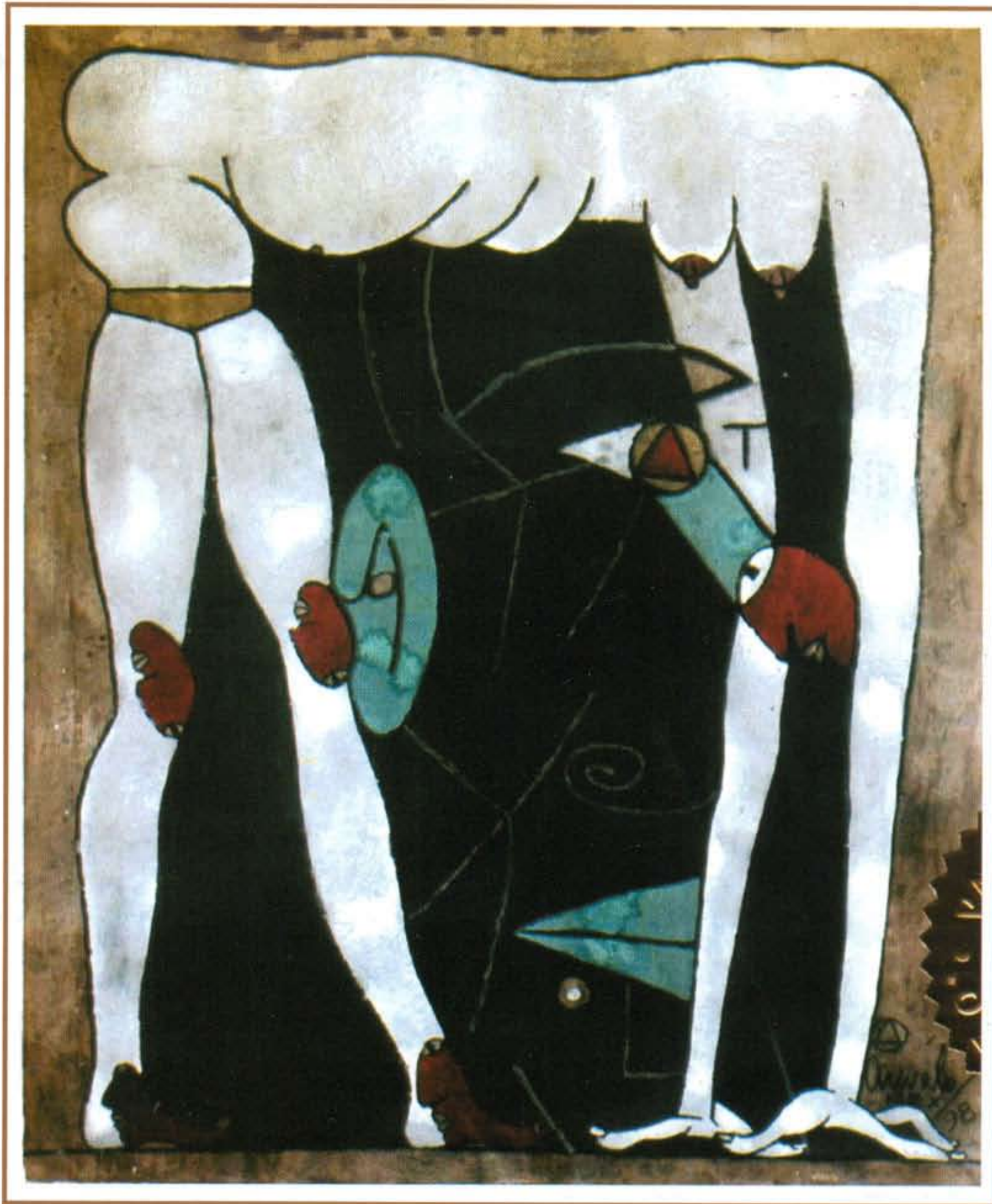
"Contorsionista". Acuarela/Papel, 113x84 cms. 1998.

Los invitamos a visitar la muestra complementaria del Mtro. Javier Arévalo a partir del Lunes 26 de Abril de 2010 en la planta alta del "Club de Industriales de Jalisco A.C."