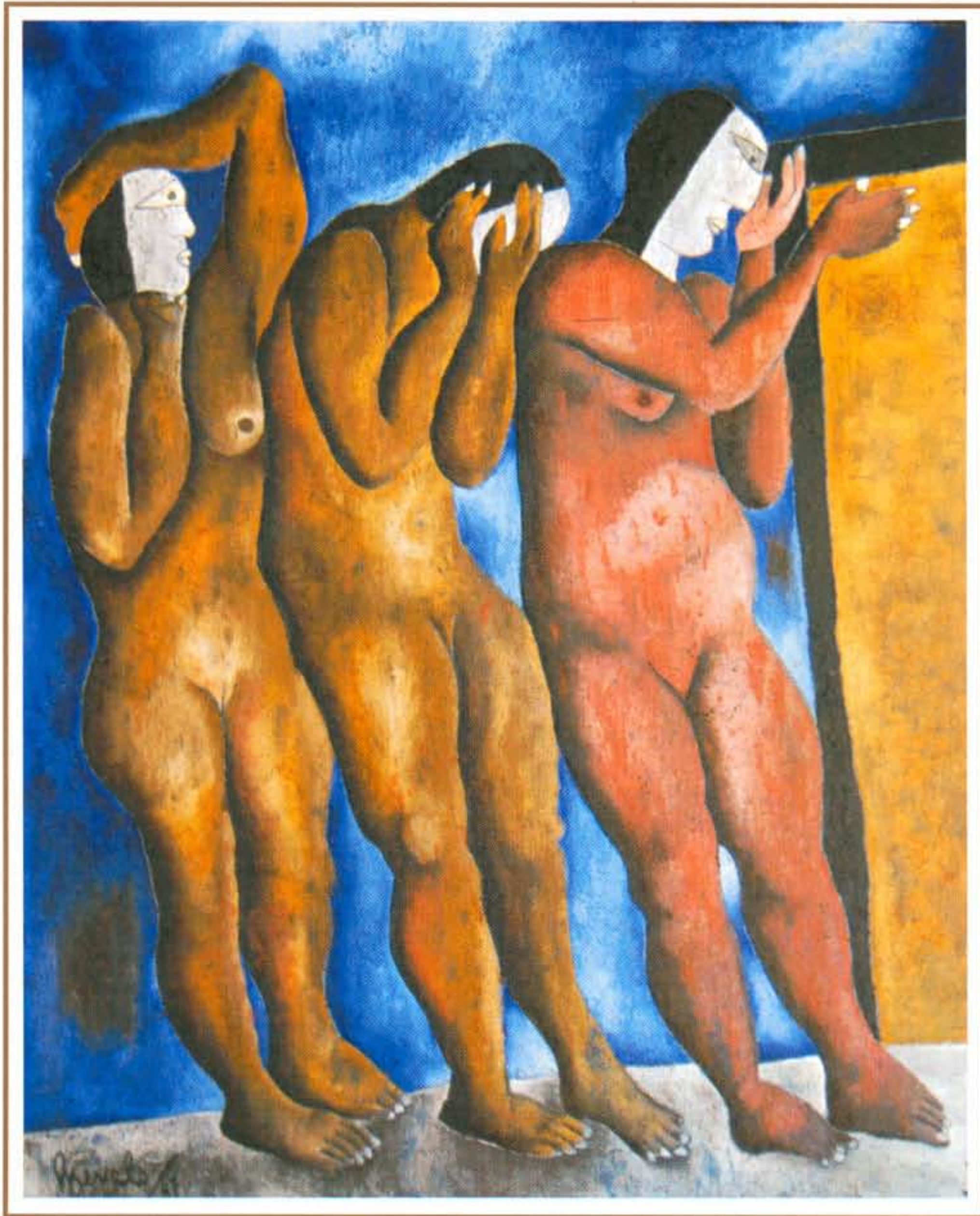
"Las tres desgracias". Oleo/Tela, 150x120 cms.