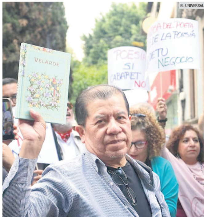
CONTROVERSIA. Un grupo de escritores se reunió para protestar en contra de la secretaria de Cultura de la Ciudad de México.