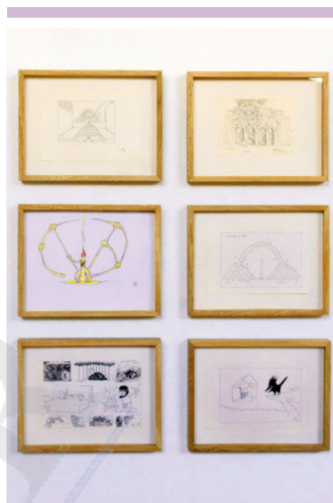
CULTURA. La muestra fue curada por Diego Orduño.

“Yo sigo en una especie de estado de asombro permanente, en una especie de pasmo. Quizá por eso me siento hermanado con un sentimiento que yo llamo místico. No soy religioso en el sentido de pertenecer a una religión organizada, nunca lo he sido, pero sí me siento participante de ese sentimiento místico. La vida es una cosa fantasmagórica”.