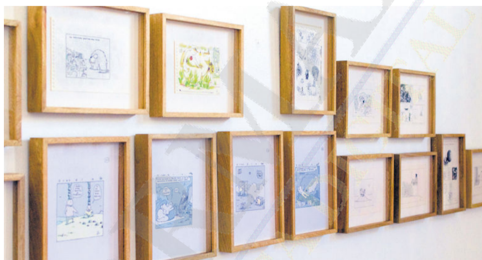
COLECCIÓN. La exposición reúne 190 piezas creadas en distintas etapas de la trayectoria de su creador.

otras sí aparecen la burla y el cuestionamiento hacia ciertos comportamientos humanos.