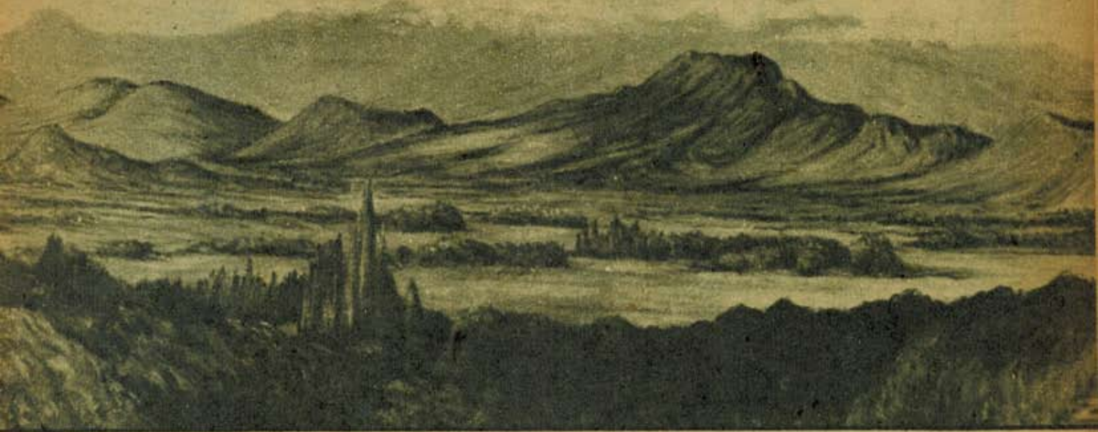
LA MAGNIFICA calidad de los paisajes de Zuno lo sitúan entre los paisajistas mexicanos junto a Velasco, Argüelles, Clausell y Atl.