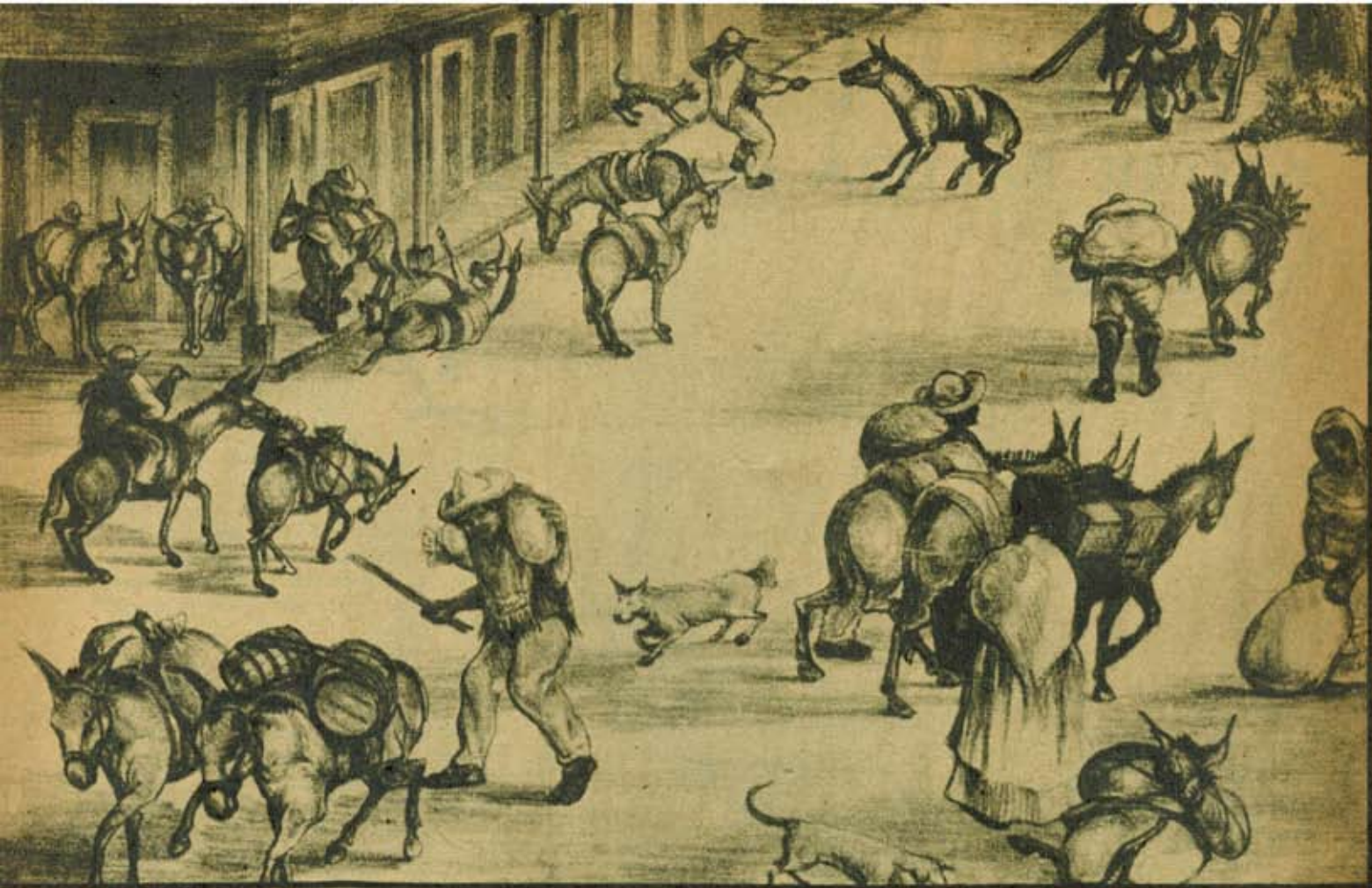
ARRIBA: "Vida de Burros" litografía hecha en 1944, donde asoma todavía el dibujante poniendo una nota irónica cuando trata la vida de nuestro pueblo. A LA DERECHA: "Vida de Perros" otra litografía lograda en el mismo año de 1944 y llena también de movimiento gracioso, finalmente crítico, que como persistente rasgo humorístico, del caricaturista que fuera Zuno en su primer época.