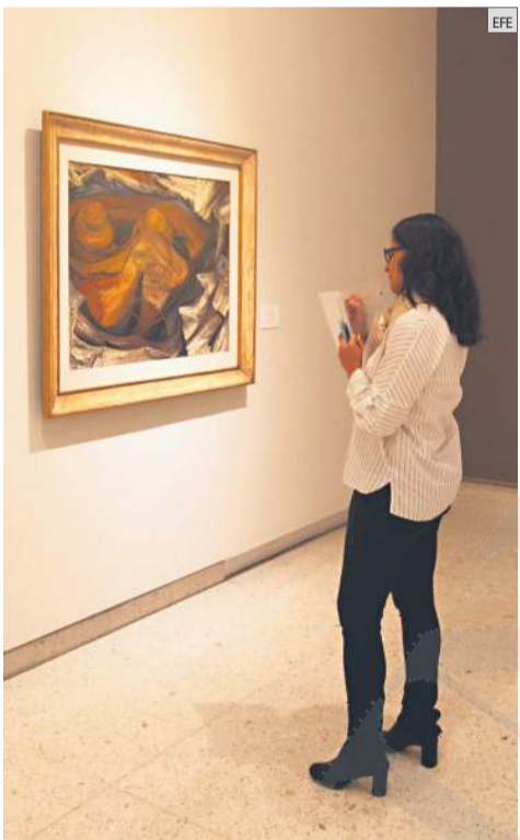
"OROZCO, RIVERA, SIQUEIROS: LA EXPOSICIÓN PENDIENTE". Recorre esta muestra a través de la página de Facebook del MUSA.

"Orozco, Rivera, Siqueiros. La exposición pendiente" llegó al MUSA en diciembre de 2019, 46 años después de haber sido cancelada en Chile por el golpe de Estado.