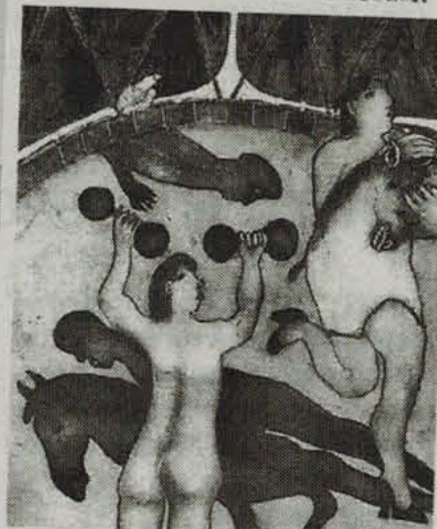
Una de las piezas de la muestra