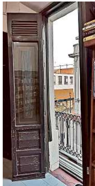
Casa Fluya está ubicada en Donato Guerra 6. Tiene dos años y medio como centro cultural.