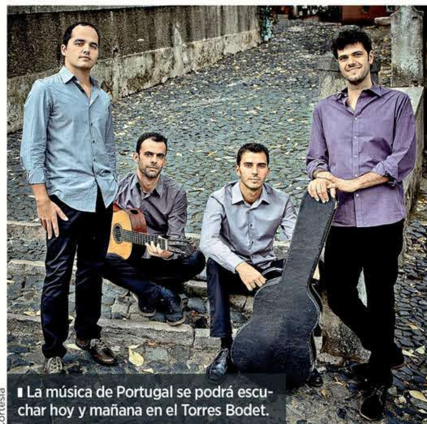
La música de Portugal se podrá escuchar hoy y mañana en el Torres Bodet.

El tenor español Plácido Domingo se retiró de la Met Opera de Nueva York un día antes del estreno previsto de "Macbeth", la obra con la que el cantante regresaba a un escenario estadounidense tras las denuncias de acoso sexual, según confirmó su representante.