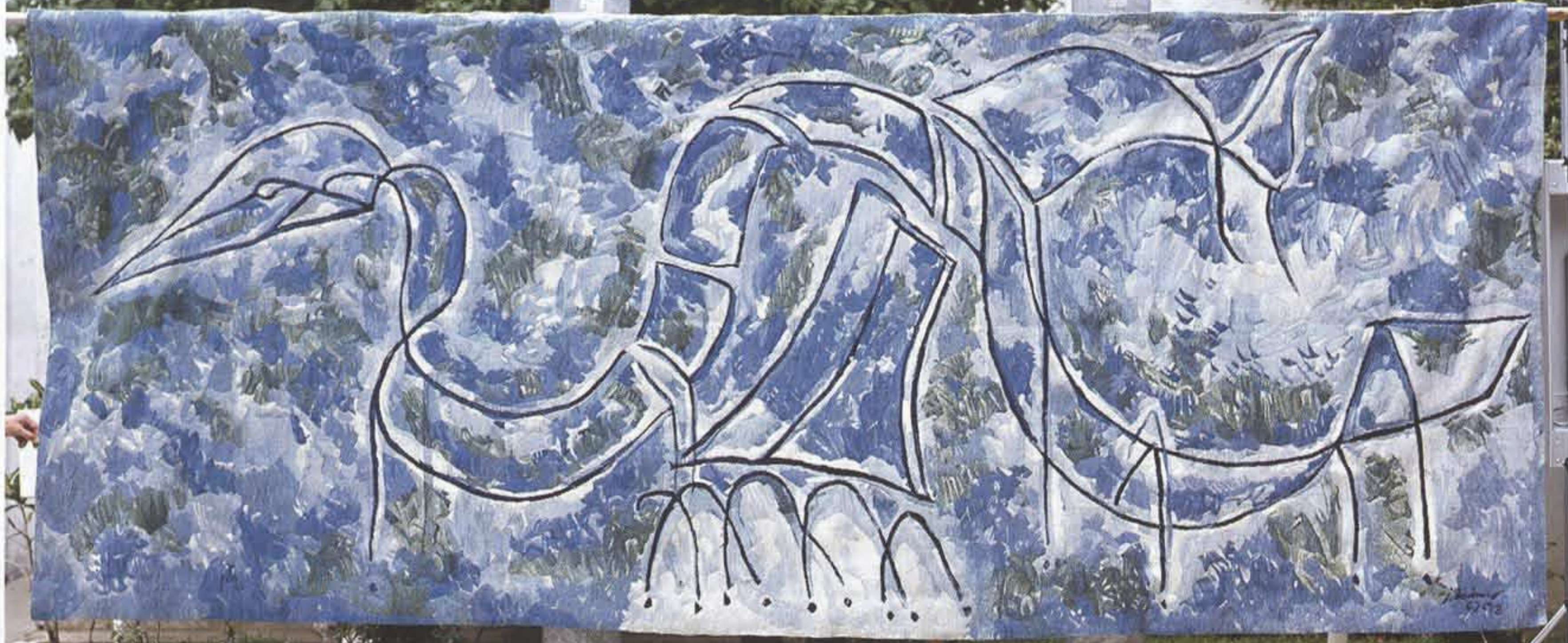
Tapiz "Serpiente Azul" 180 x 433 cms, colgando al exterior del Taller, arriba . La obra realizada fue a partir de un cuadro que se puede apreciar en el Museo de Arte Moderno de la ciudad de México. Juan Soriano en el Taller de Gobelinos de Guadalajara, abajo , durante la realización del tapiz "Serpiente Azul".