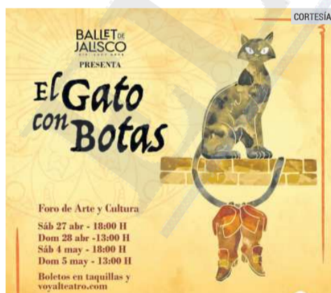
BALLET. El clásico infantil llegará al Foro de Arte y Cultura.