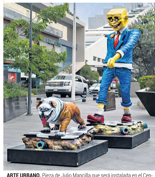
ARTE URBANO. Pieza de Julio Mancilla que será instalada en el Centro Histórico de Guadalajara.