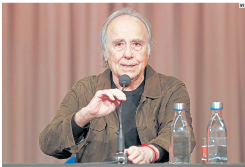
JOAN MANUEL SERRAT. El cantautor ofreció una rueda de prensa desde Barcelona, tras conocer que fue premiado.

Sintiéndose "hijo de una cadena", que espera que continúe en el futuro, también confía en tener tiempo para disfrutar con "la serenidad y la distancia que merece" el premio Princesa de Asturias, que en ediciones anteriores ganaron otros cantantes como Bob Dylan y Leonard Cohen.