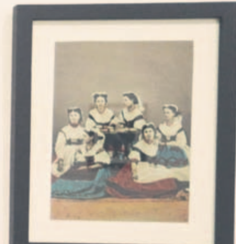
OCTAVIANO DE LA MORA. Piezas de uno de los retratistas más destacados del siglo XIX en México. Aquí presenta su visión de la figura femenina.