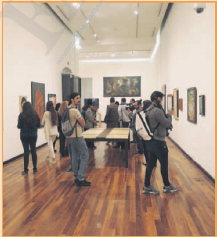
“AUSENCIAS/PRESENCIAS”. La muestra reúne la obra de las artistas que forman parte del acervo del Museo Cabañas.

El ICC desarrolla un programa que incluye diálogos, cine, talleres y activaciones en torno a la equidad de género; entre las actividades se encuentra la exposición “AUSENCIAS/PRESENCIAS”