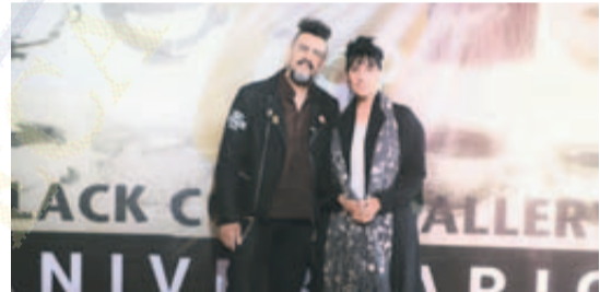
INVITADOS. La cena tuvo la presencia del director Alfonso Arau.

La celebración del décimo aniversario de Black Coffee Gallery siguió el pasado viernes con la presentación de la publicación y el video documental titulado "Entre bastidores" con la participación de 30 artistas en su estudio, en la sala de cine Guillermo del Toro ubicada en el Instituto Cultural Cabañas.