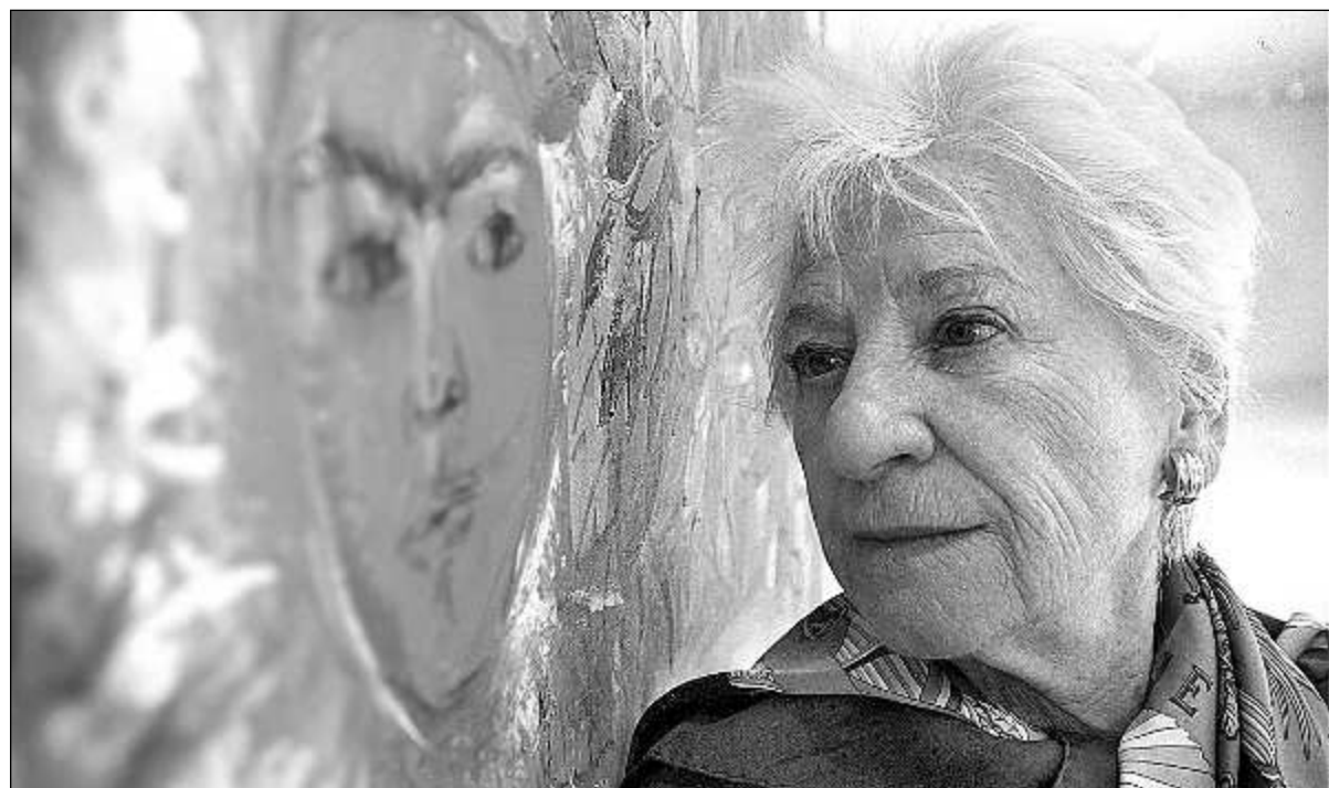
La pintora afirma que se inspira de la música y de la naturaleza.

Destacan los conciertos de las orquestas Filarmónica de Jalisco (OFJ), con la que actuarán solistas estudiantes y maestros del departamento, la Sinfónica de la UdeG, constituida formalmente como tal el 25 de mayo de 1999.