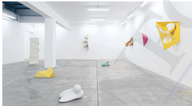
GARTH EVANS (CHESHIRE, REINO UNIDO). La exhibición se presenta una selección de las primeras obras hechas en Gran Bretaña, así como obras hechas en Estados Unidos. Esta muestra deriva de otra gran exhibición de la obra de Evans en Chapter Arts, Cardiff, en Gales, junto con una gran reinstalación de obra pública que hizo el artista para la ciudad en 1972.