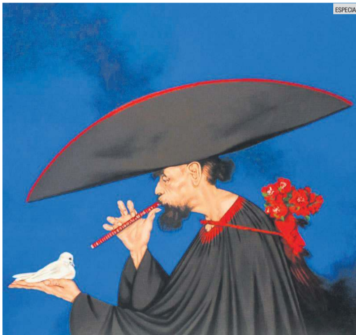
“CONCIERTO AL PICHÓN”. Pieza destacada del fallecido artista plástico.