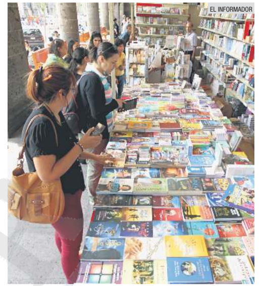
FERIA MUNICIPAL DEL LIBRO. Del 12 al 26 de mayo habrá muchas letras en el Centro tapatío.

Este viernes 12 de mayo arrancan las actividades de la 51 edición de la Feria Municipal del Libro y la Cultura Guadalajara 2019, entre éstas se incluyen presentaciones de libros y venta de éstos, además de talleres entorno a la literatura y otras temáticas.