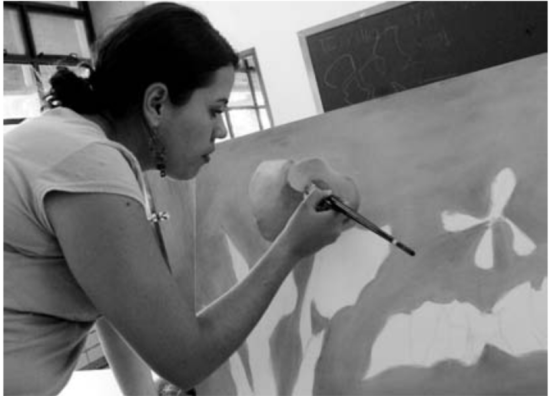
LOS ALUMNOS cursan la materia optativa de Pintura

“Hay mucha emoción con cerrar con la exposición de tres o cuatro cuadros de cada uno. Yo considero que ponen mucho esfuerzo y han creado una obra que vale la pena”, destacó Pointelin, quien además reconoce que ante la naturaleza optativa de esta clase se ha encontrado con estudiantes que verdaderamente tienen deseos de pintar, quienes con base en sus conocimientos estéticos y de ordenamiento, adquiridos previamente como arquitectos, pudieron vincularlos