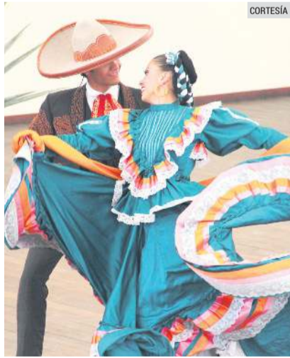
A FESTEJAR. Mariachi y danza folclórica, parte del cumpleaños de nuestra ciudad.