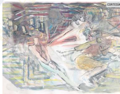
“HONORABLE CABALLERO” (2021). Obra reciente de Roberto Rébora.